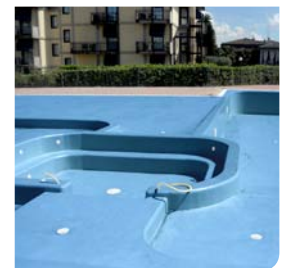
6. Application résine Polyuréthane