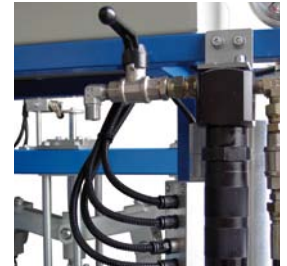
3. Réchauffeur et filtre