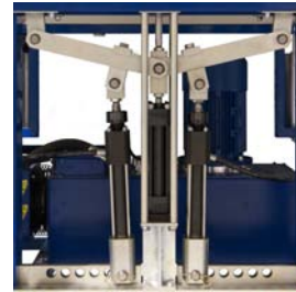
2. Haute pression