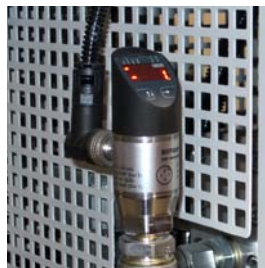
4. Capteur de pression avec séparateur