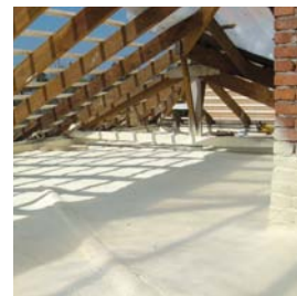
5. Projection de mousse polyuréthane (sous toiture)