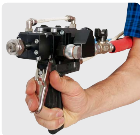
MIXING HEAD HMG

Testa di miscelazione HMG Tête de mélange HMG